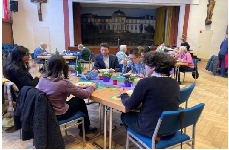
Ein Essen als Zeichen der Solidarität mit den Armen und Hungernden

Zum dritten Mal lud die kfd St. Sebastian alle Interessierten zu einem Fastenessen zugunsten von Misereor in den Pfarrsaal von St. Sebastian ein. Die Messe vorher wurde ebenfalls von der kfd gestaltet und dem Thema der Misereor-Fastenaktion „Interessiert mich die Bohne...“ gewidmet. Die Spenden unterstützen die MISEREOR – Projektarbeit, insbesondere die Landpastoral in der Diözese Pasto in Kolumbien, die sich mit alternativen Anbaumethoden, für eine gerechte Welt ohne Hunger und eine höhere Wertschätzung unserer Ernährung einsetzt. Ein Eintopf kolumbianischer Art erbrachte so Spenden in Höhe von 310,00 €. Herzlichen Dank allen BesucherInnen und SpenderInnen.