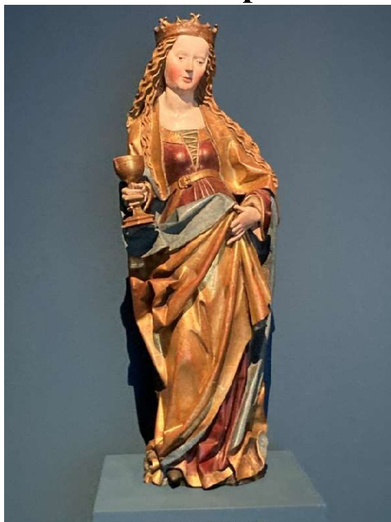
Werkstatt des Meisters des Retabels in Lautern, Hl. Barbara ca. 1509, farbig gefasstes Holz, vergoldet

Nach einem ungeplanten 40-minütigen Aufenthalt in der Kälte von Gleis 2 Bahnhof Oberwinter (verspäteter RB) wurden wir von unserer Führerin bereits erwartet. Unsere Mühen wurden durch eine sehr interessante und tiefgründige Führung belohnt. Die religiösen Gemälde und Skulpturen illustrierten den Lebens- und Leidensweg Christi, Märtyrer und Heilige vom Mittelalter bis in die Anfänge der Moderne. Durch die Erklärungen erhielten wir einen Zugang zu der Verbindung von Spiritualität und Leiblichkeit, die seit dem Altertum ein Motiv in vielen Religionen ist. Nach der Führung erhielten wir dann auch noch Einblick in das Arp-Labor, das zahlreiche kreative Möglichkeiten für Kindergärten, Schulklassen, Kinder- und Erwachsenen-gruppen anbietet. Zum Abschluss konnten wir im Restaurant noch Kaffee und Kuchen bei einem herrlichen Ausblick auf den Rhein und das Rheintal genießen. Es war ein rundherum gelungener Nachmittag.